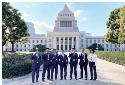
国会議事堂と外務省の視察 林事務所青年部の方と訪問しました。 11月9日