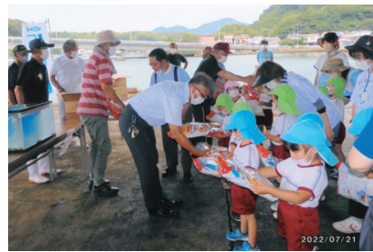
江崎地区の稚魚の放流行事に参加 7月21日