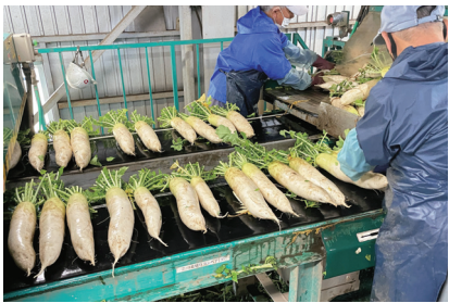
むつみ千石台だいこん出荷準備の視察 5月27日