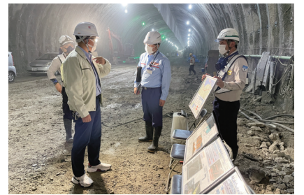
木と防災道路工事、視察・見学 進捗状況の確認へ行きました。 8月22日