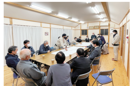
木間地域道路整備地域説明会への参加 12月16日