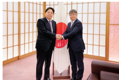
林芳正衆議院議員と対談 11月9日