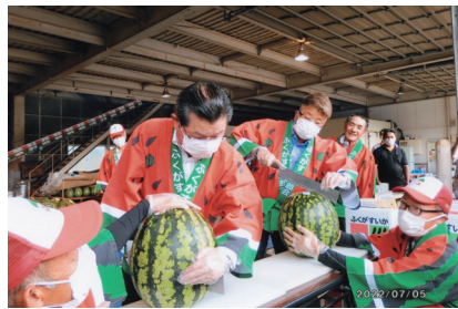
福賀スイカ出荷式に参加 7月5日